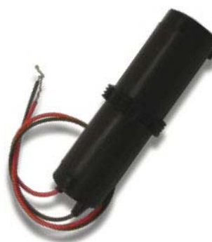
内蔵されている Teledyne Benthos 社製 ハイドロホンエレメント、AQ-2000

(株)ジオシスは Geotomographie 社の日本における代理店です。同社は Type4 の他にも、各種ジオホン、ハイドロホンを開発・製造しています。