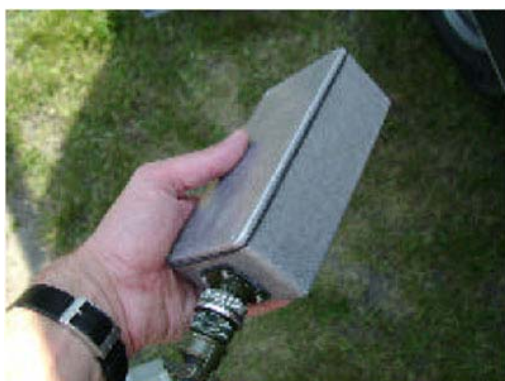
標準装備の地表用バッテリーボックス